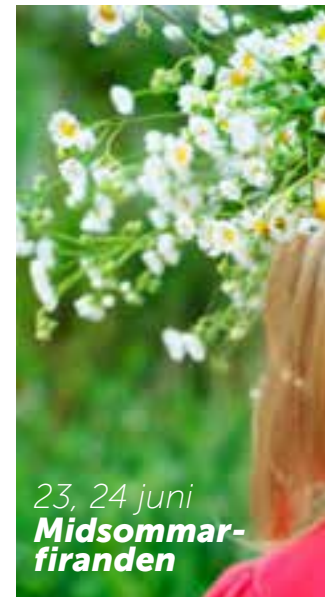
23, 24 juni Midsommar- firanden

Det händer mycket i vår lilla stad i sommar! Kalendariet i den här tidningen sträcker sig ända till mitten av september. Det innebär att evenemang kan förändras och tillkomma. Håll utkik på evenemang. eskilstuna.se för uppdaterad information och fler evenemang.