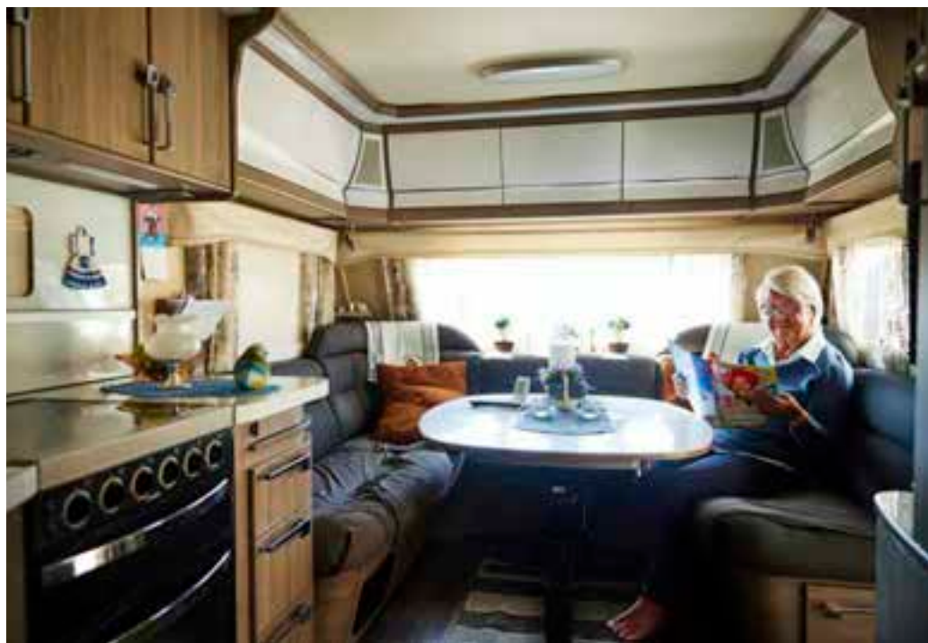
17 kvadratmeter plus lika mycket i förtältet - det är en liten yta, men utanför finns grönt gräs och Mälarens blåa vatten.

I Mälarmönan finns 78 platser för husvagnar, husbilar och tält, plus en handfull faluröda småstugor för uthyrning. 35 av platserna är avsatta för långvariga säsongplatser, men det är inte så många som nyttjar sina platser året runt.