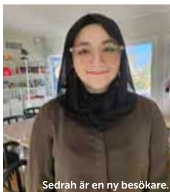
Sedrah är en ny besökare.