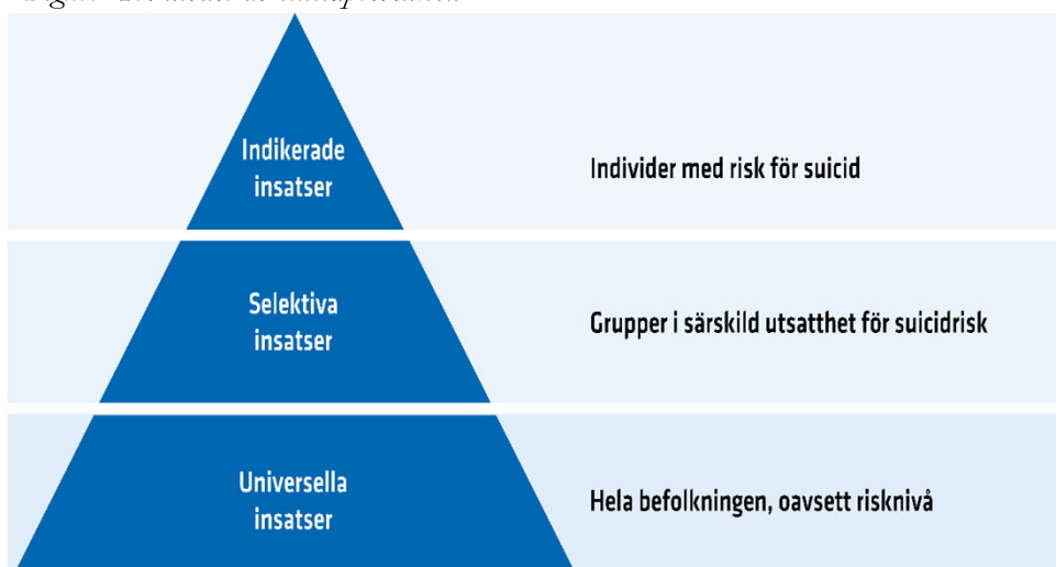
Figur: Tre nivåer av suicidprevention

Det suicidförebyggande arbetet behöver finnas på olika nivåer och arenor och kombinera insatser till individer och hela befolkningen. Insatserna kan delas in i tre nivåer: