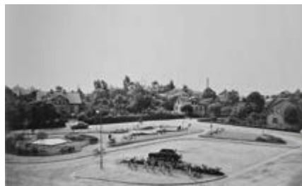
Östra torget 1954.

Tyvär hade en annan bild än vad som var tänkt kommit med i förra numret av Torshälla runt (nr 2 2024, sidan 9). Den tänkta bilden visar Östra torget 1967 och man kan se Vattenbärskan på den. Bilden som är med i tidningen är från 1954.