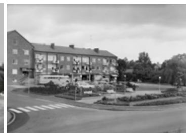
Östra torget 1967.