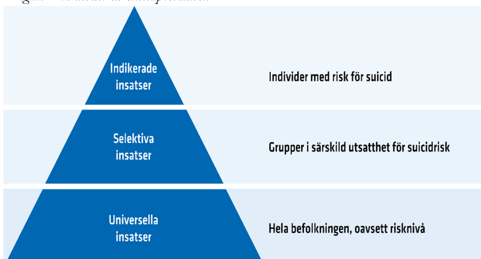
Figur: Tre nivåer av suicidprevention

Det suicidförebyggande arbetet behöver finnas på olika nivåer och arenor och kombinera insatser till individer och hela befolkningen. Insatserna kan delas in i tre nivåer: