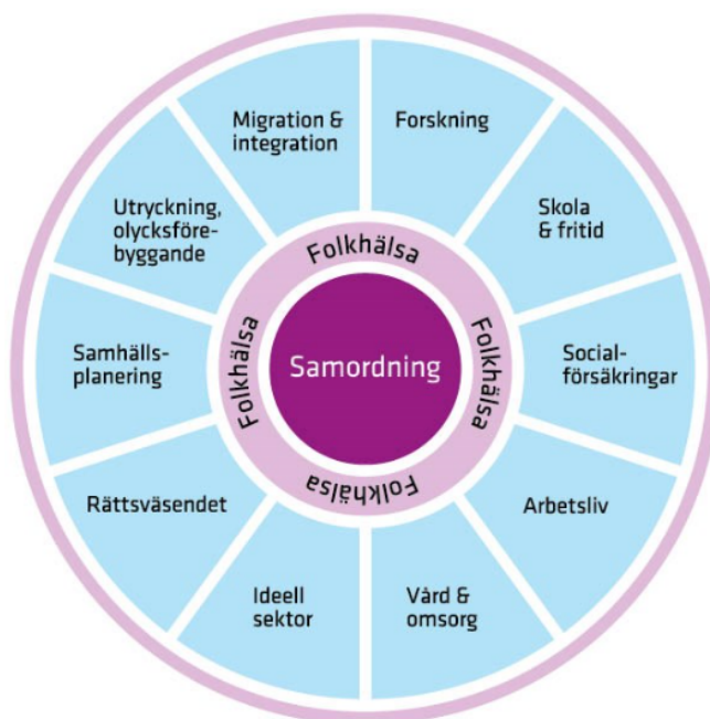
Bild som beskriver den nationella samordningen inom suicidprevention

Folkhälsomyndigheten (FoHM) fick år 2015 uppdraget att samordna arbetet med suicidprevention på nationell nivå. Uppdraget fokuserar på att det förebyggande arbetet ska bedrivas enligt bästa tillgängliga kunskap och evidens.