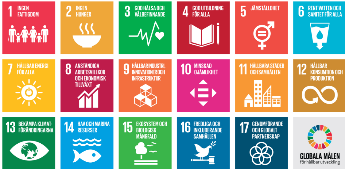
Bild 1: Hämtad 2024-02-28, Globala målens hemsida, Logotyper - Globala målen (globalamalen.se)