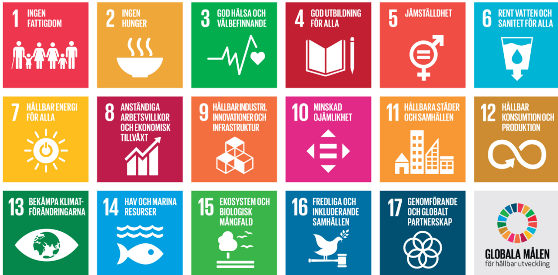
Bild 1: Hämtad 2024-02-28, Globala målens hemsida, Logotyper - Globala målen (globalamalen.se)