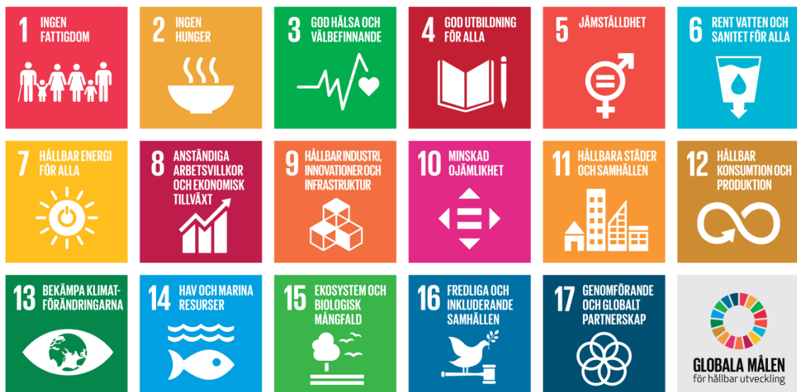
Bild 1: Hämtad 2024-02-28, Globala målen hemsida, Logotyper - Globala målen (globalamalen.se)